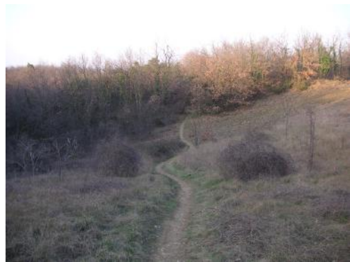
22 – La boucle est presque terminée, le sentier surplombe une caisse de camion