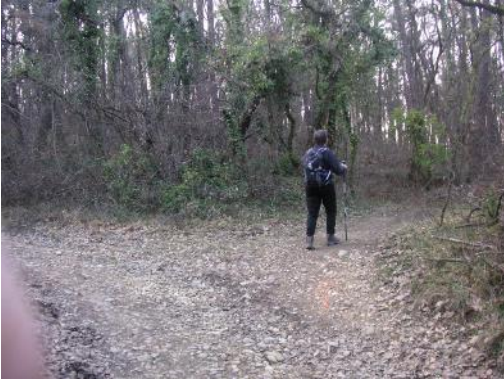
20 – Tourner à droite