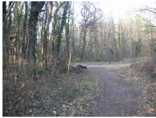
21 – Suivre ce petit sentier