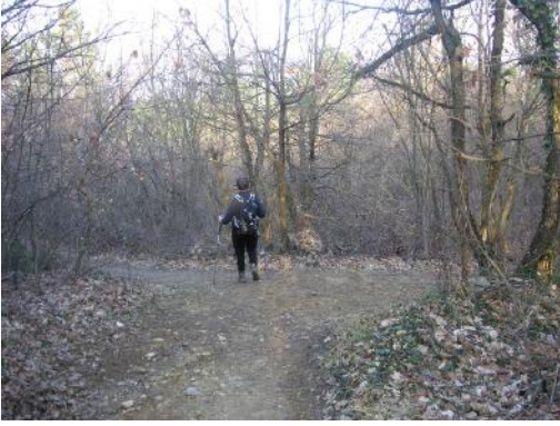
20 – Tourner à droite